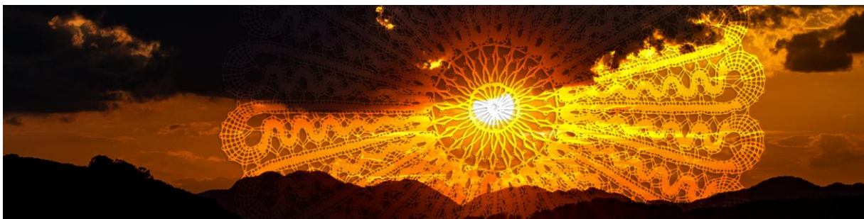
Slika: Označnica Gradske knjižnice Ivana Belostenca Lepoglava

Označnica/straničnik/bookmark kao „podsjetnik u malome“ sadrži sve važne podatke vezane uz našu Knjižnicu; radno vrijeme, mail, kontakt te sa stražnje strane kalendar.